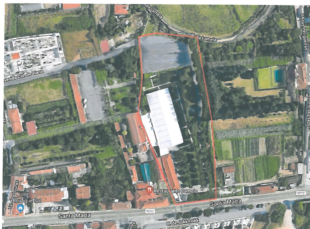
Fig. 5 – Vista Aérea – Quinta S. João