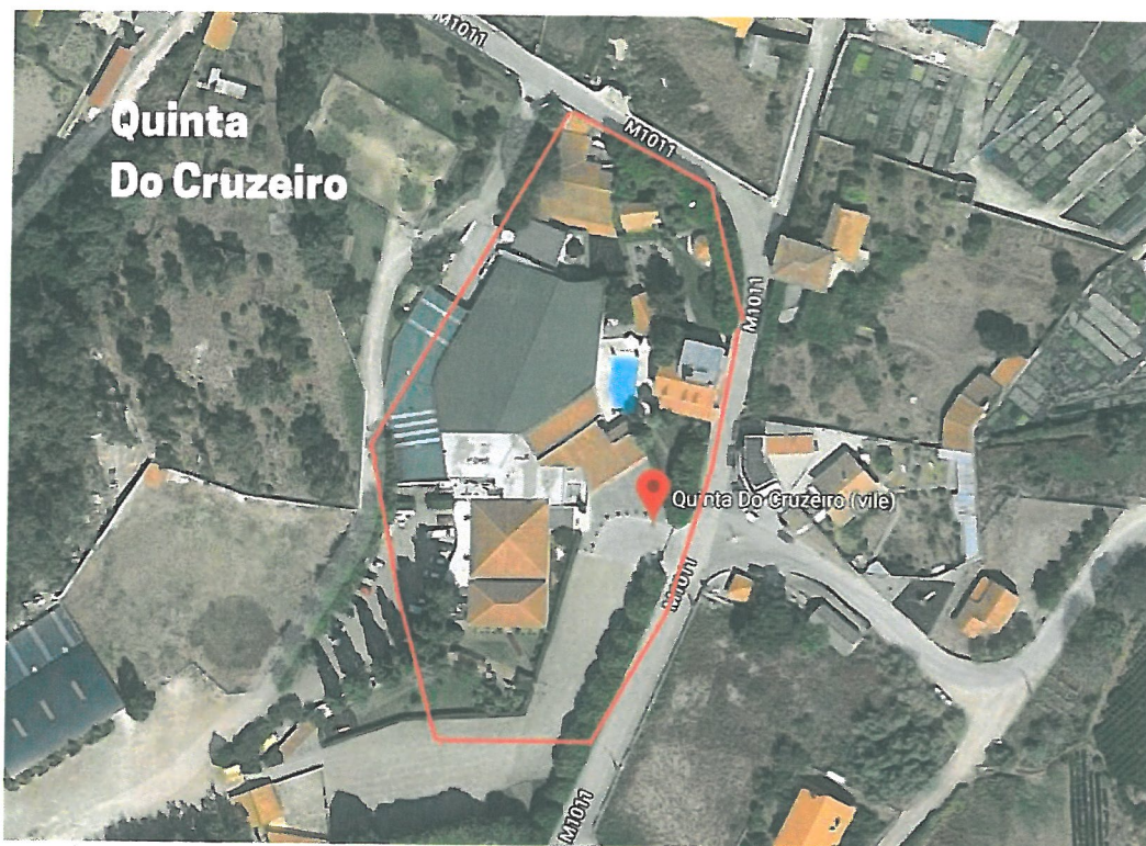
Fig. 2 – Vista Aérea – Quinta do Cruzeiro