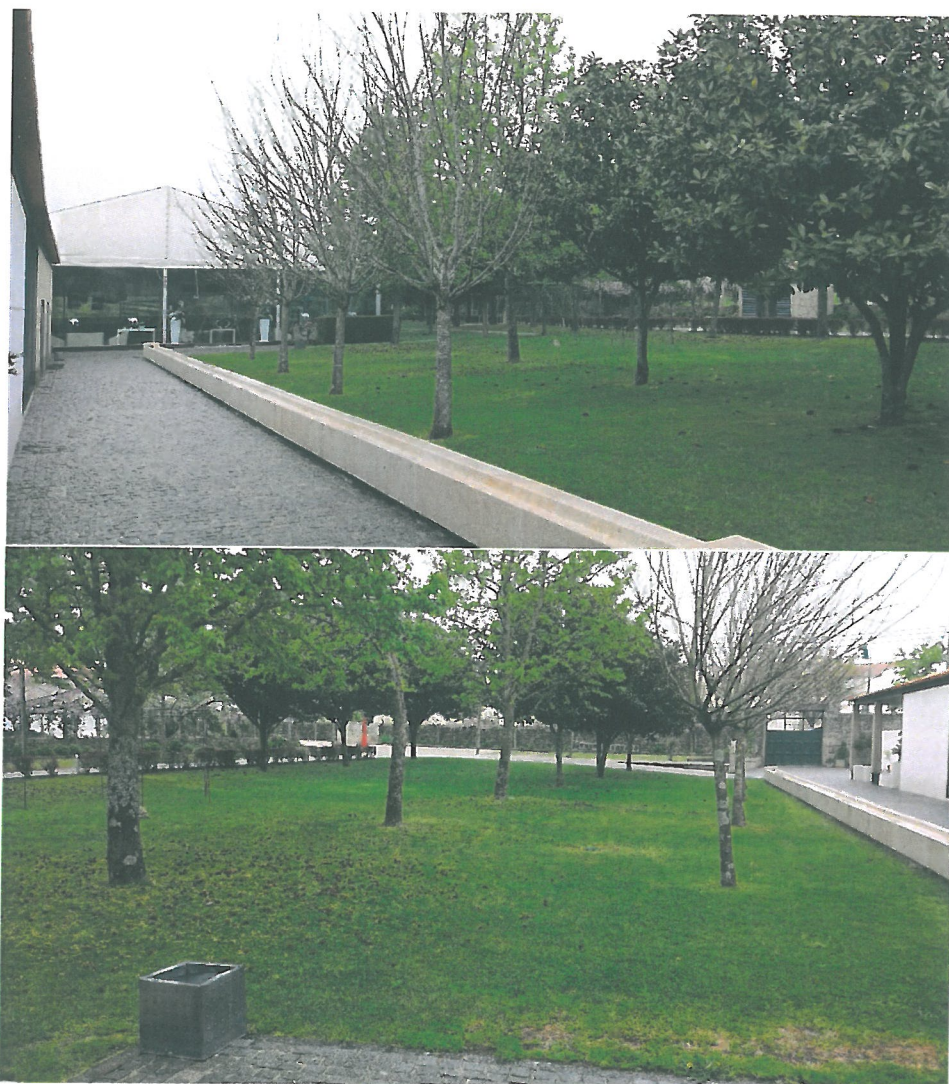
Fig. 1 – Parte do jardim (sem mobiliário) – Envolve toda a sala