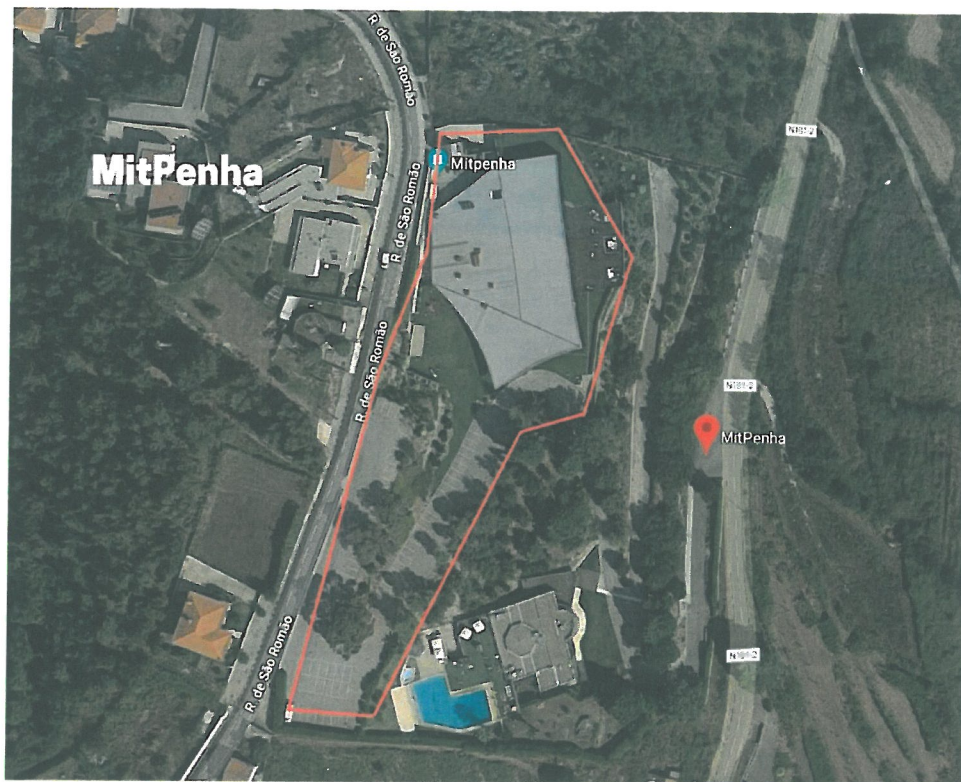
Fig. 5 – Vista Aérea – MitPenha