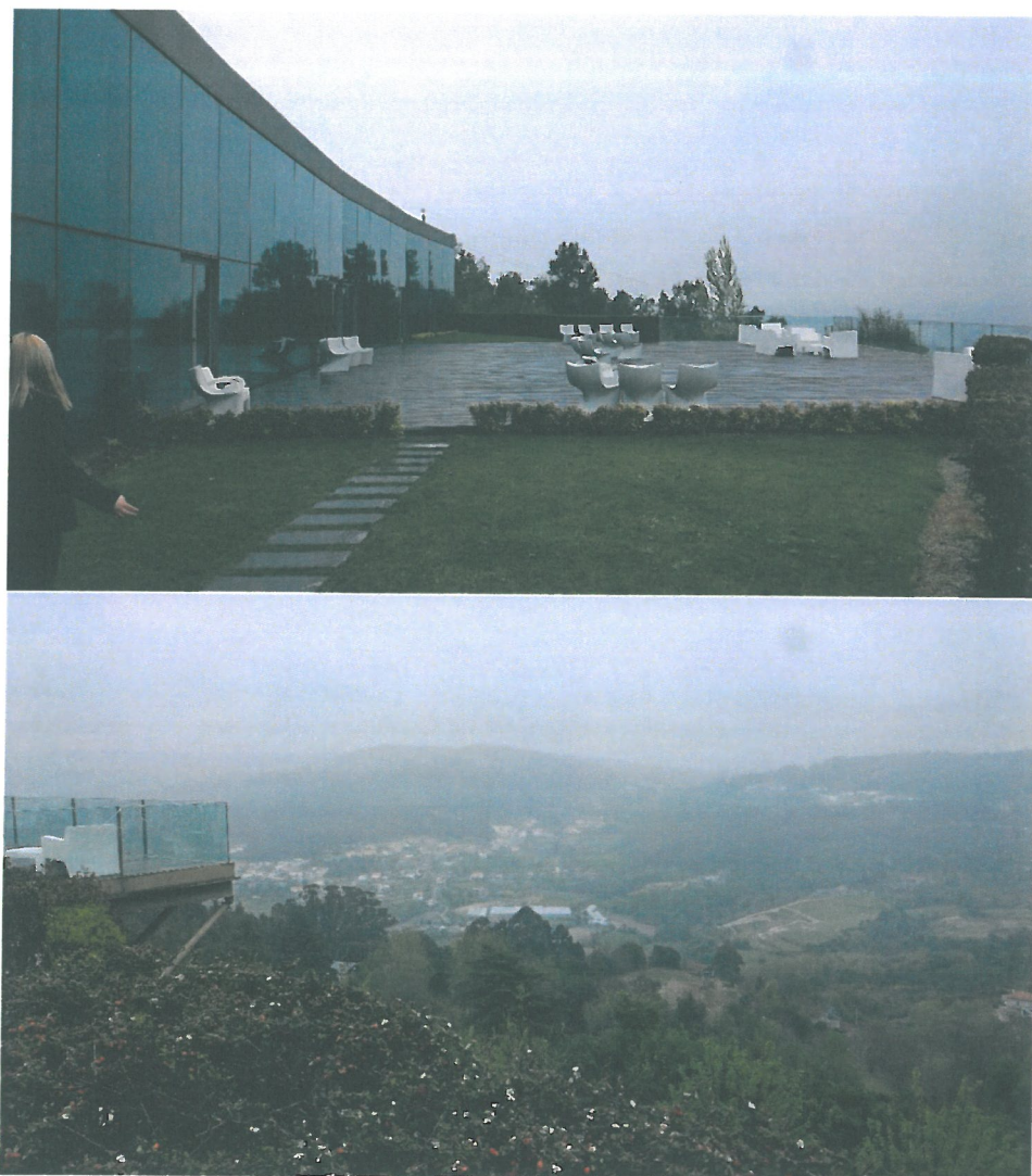
Fig. 1 – Exterior – Deck principal e paisagem