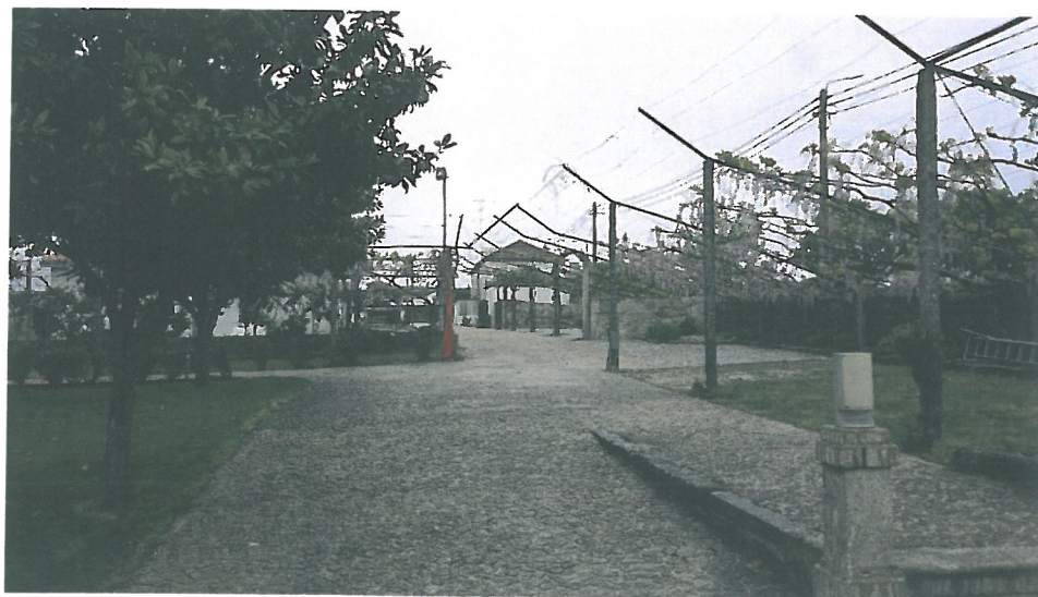
Fig. 3 – Outra zona do exterior