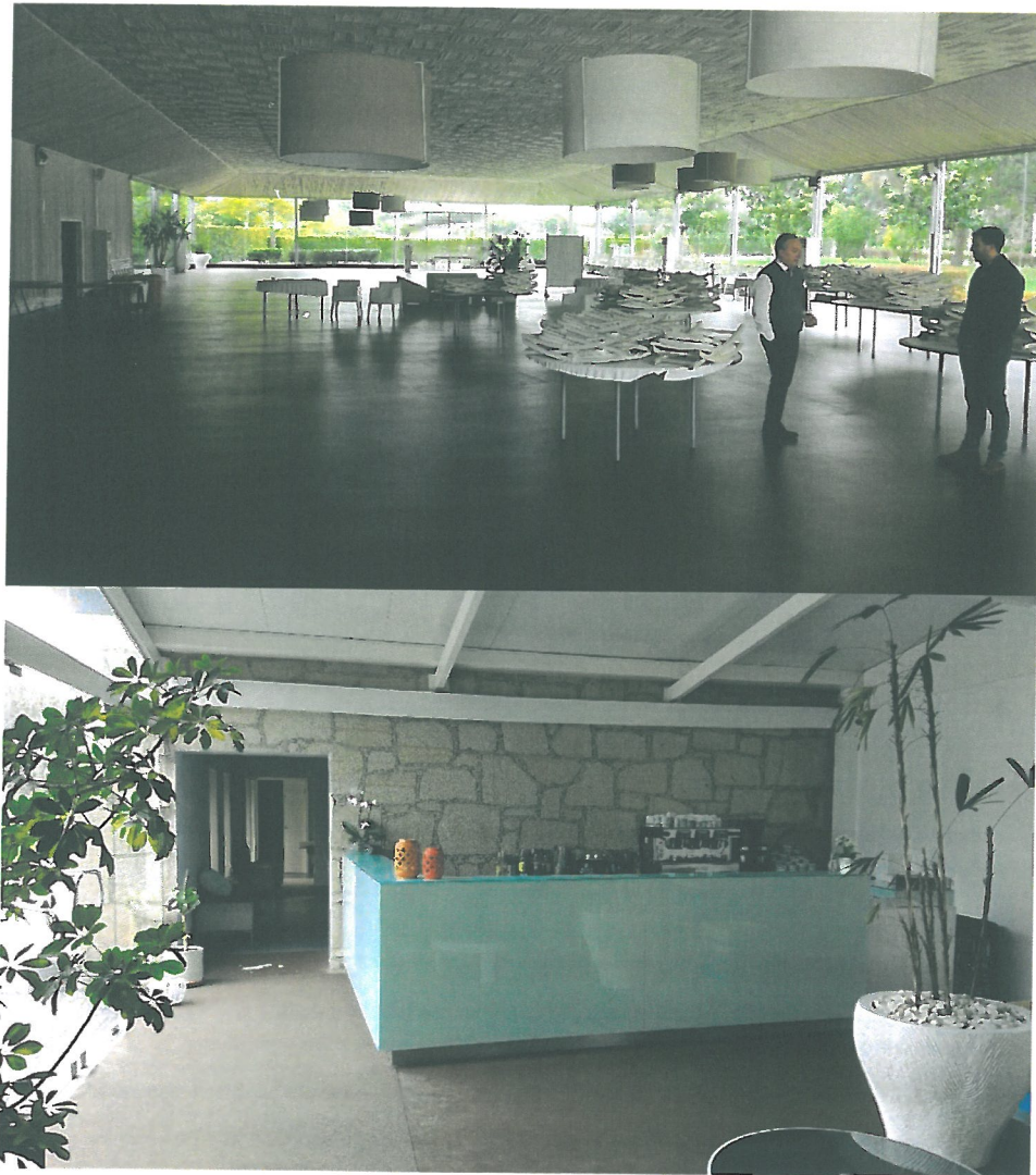
Fig. 2 – Pormenores da sala